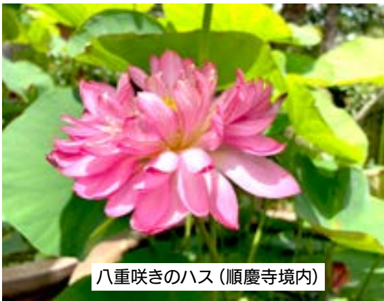
八重咲きのハス(順慶寺境内)

今年は、役員さんが八重咲きのハスの種を安城市の本證寺さんから買ってきて、立派な花を咲かせることができました。