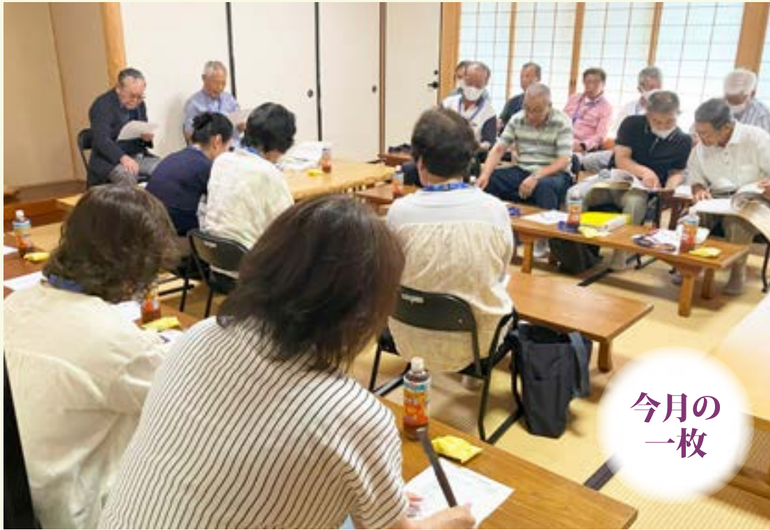
教化委員会の模様（令和6年7月26日・順慶寺玄関にて）