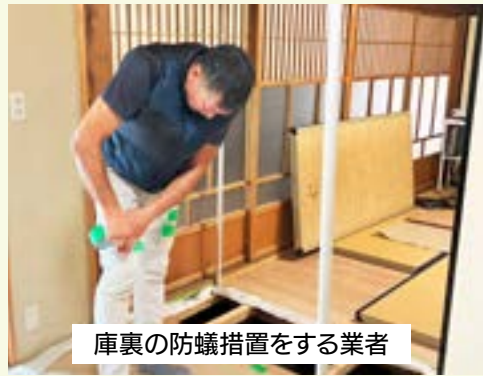
庫裏の防蟻措置をする業者